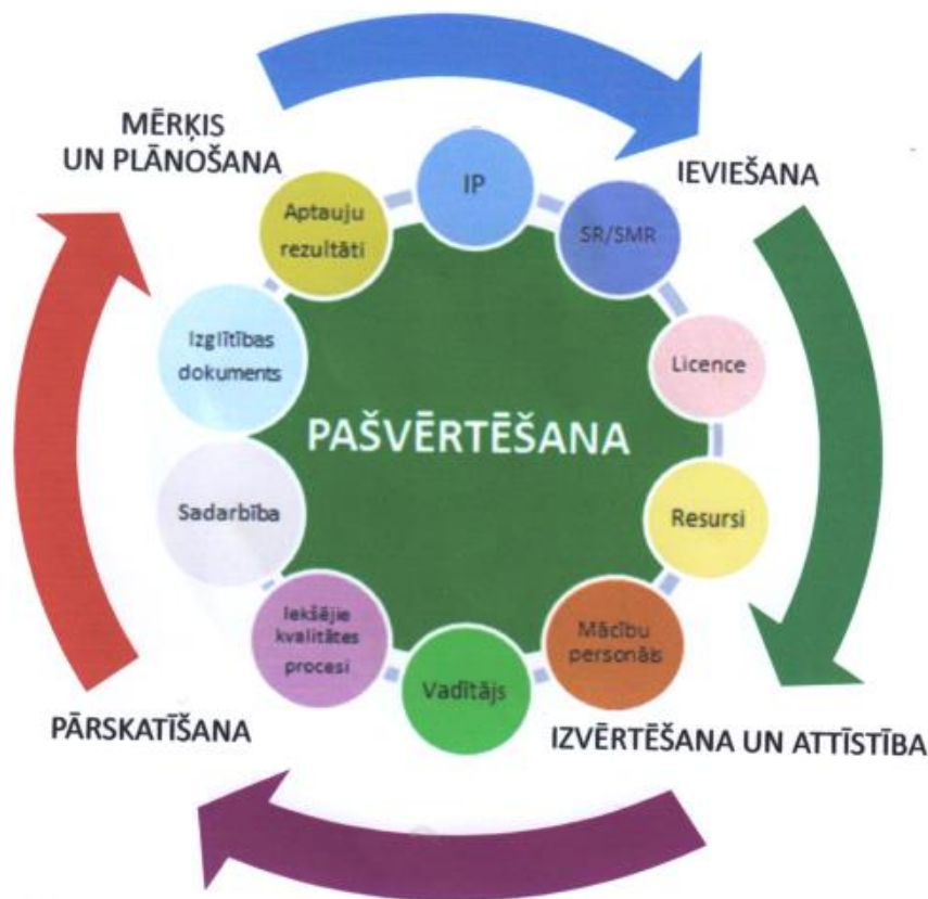
1. attēls. Pieaugušo neformālās izglītības kvalitātes nodrošināšanas modelis.

Saīsinājumi: IP – izglītības programma; SR/SMR – sasniedzamie rezultāti/sasniedzamie mācīšanās rezultāti